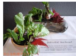
ルネ・レゼッピ氏の一皿

白味噌とマスタードをベースにしたソースを植木鉢に盛り、モルト・ビール・ナッツのミックスを乾燥させたフレークを載せ、取れたての京野菜を盛り込んだ一皿。印象的な見た目もさることながら、味わい深いソースとトッピングという日本+デンマークの味で滋味ぶかい京野菜がさらにおいしい一品。もう一品のソルベはゆずのソルベにささめ昆布をふったデザート。昆布のうま味が柚子の品のいい風味をさらに引き立てた、これも意表をついた組み合わせ。