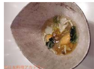
ダビッド・キンチ氏の一皿

フォワグラ・あわび・ミル貝・雲丹・おぼろ昆布を丁寧に重ねた深鉢に温度の異なる二種のスープを回しかけた一品。自らのレストランが面している太平洋の海をイメージしながら創作。利尻昆布・マグロ節・生しいたけのだしが海の香りをそえた。