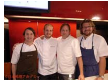
左からルネ・レゼッピ氏、ハンス・ヴァリマキ氏、ダビッド・キンチ氏、マイケル・シムラスティ氏

研修最終日の公開ワークショップでは、日本での研修の成果をもとに、各シェフが趣向を凝らした創作料理を披露した。当日は国土交通省 前原誠司大臣を来賓としてお迎えし、日本の今後の発展において観光産業は重要なポイントであり、日本料理は大きなコンセプトの一つであるという激励のお言葉をいただいた。