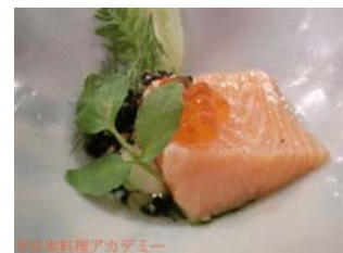
ハンス・ヴァリマキ氏の一皿

オリーブオイルと塩・ハーブでマリネした鮭を温度に気を配って焼き上げ、いくら、タピオカ、おかき、柚子味噌などで飾り、鮭とマグロのだし汁を添えたもの。日本とフィンランドには、発酵食品が多いなどの共通点もあると語り、添えたブイヨンフィンランド風だしとネーミング。